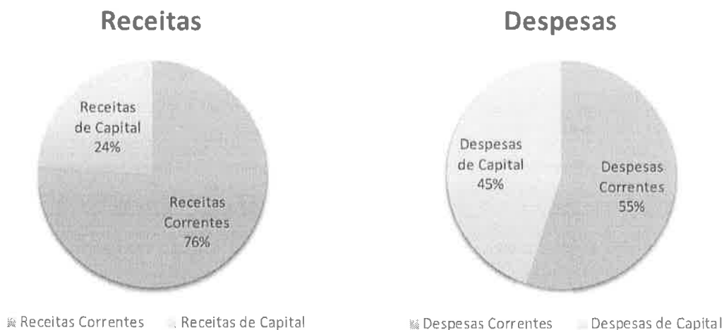
Quadro 2 - Estrutura da Receita e da Despesa

Em termos relativos verifica-se que a receita corrente representa 76% da receita total enquanto a receita de capital representa 24%. Na componente da despesa o peso relativo das despesas correntes fixa-se nos 55% da despesa total, em contrapartida, a despesa de capital ascende a 45%.